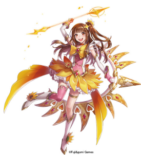
▲えいたそ（CV：成瀬瑛美）