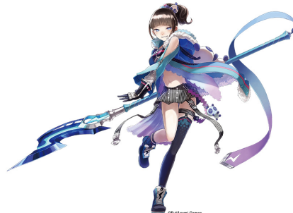
▲ピンキー（CV：藤咲彩音）