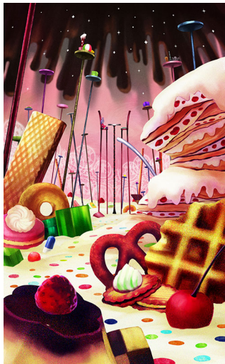
▲お菓子の魔女ステージ