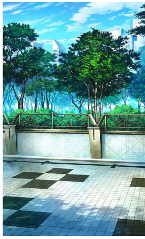
▲オリジナルステージ 通学路