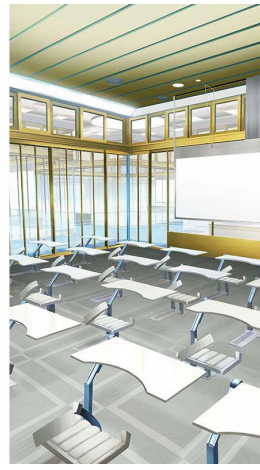
▲オリジナルステージ 教室