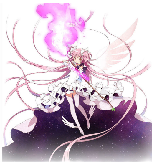
▲アルティメットまどか (CV : 悠木碧)