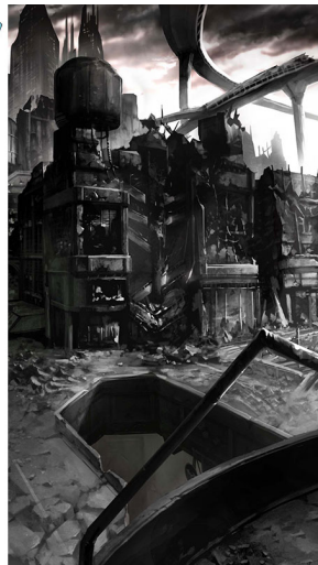
▲ワルプルギスの夜ステージ